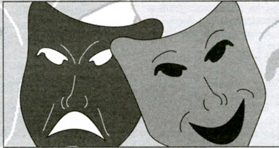
Dans le cadre des rencontres de la Journée mondiale du théâtre, organisée par le Conseil québécois du théâtre, les étudiants d'art dramatique de l'UQAM proposent à la communauté universitaire plusieurs activités exceptionnelles.

• Portes ouvertes sur le théâtre japonais (sous la direction de