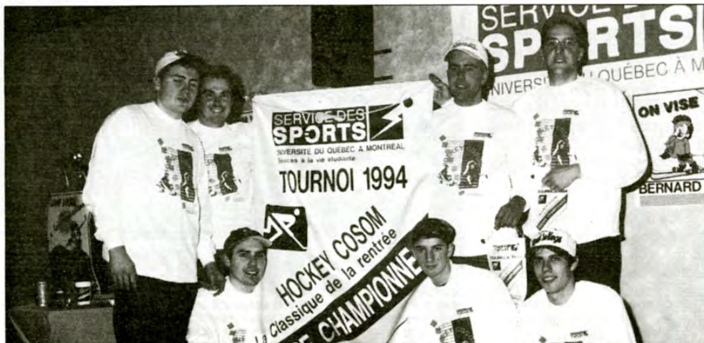
Tournoi Hockey Cosom 1994. Les Cougars, du module d'administration, ont remporté la 5e édition de la Classique de la rentrée. Douze équipes d'autre modules et de l'ETS participaient au tournoi. Le prochain grand rendez-vous du service des sports est la classique des sucres en mars prochain, tournoi annuel de volleyball, le plus populaire de tous.