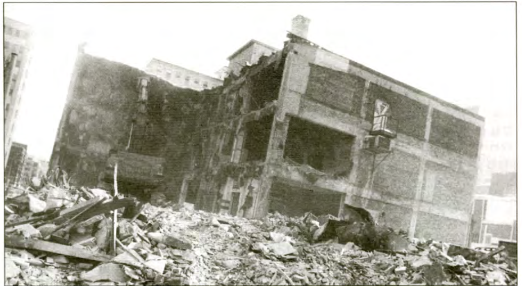
C'est parti! Cet immeuble vétuste de la rue Sanguinet, qui abritait jadis un commerce de motocyclettes, fera bientôt place au nouveau centre sportif et aux résidences étudiantes. Détruire pour mieux reconstruire...

donc être terminé à l'été 1995. La superficie du centre, qui comprendra notamment une piscine semi-olympique et un grand gymnase triple, sera de 5000 mètres carré net. Quant à la résidence d'étudiants, d'une hauteur de dix étages, elle fera 12,000 mètres carré et comportera 411 lits, répartis en petits studios et en appartements de deux et huit chambres. Son inauguration est prévue pour l'automne 1995.