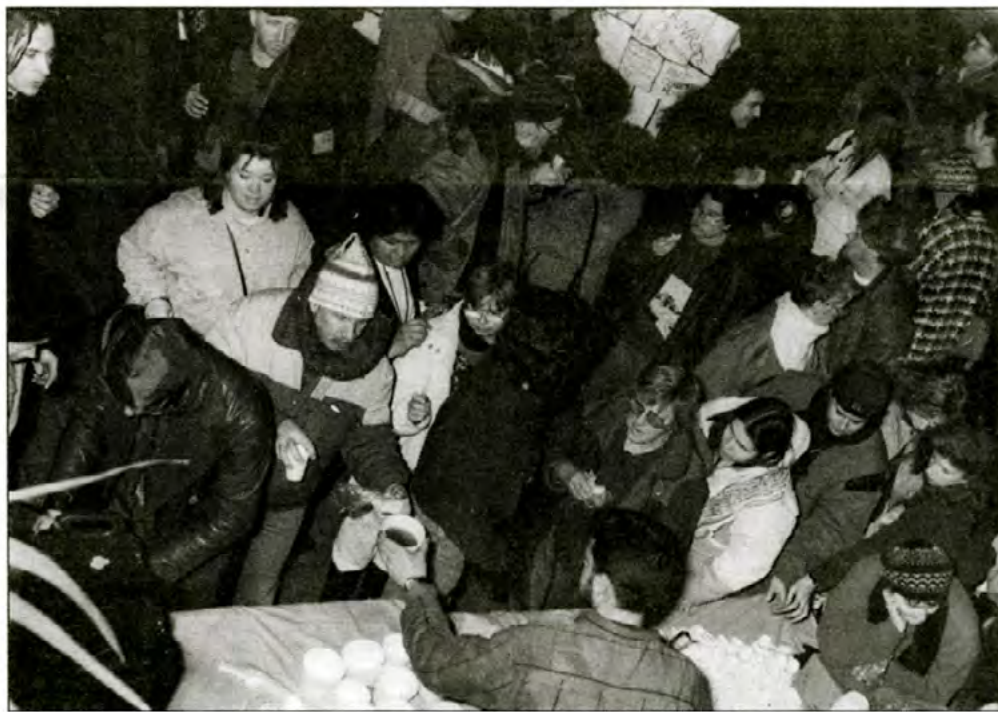
Après avoir érigé devant les bureaux régionaux de l'aide sociale un "mur de la honte", symbole de l'écart grandissant entre les riches et les pauvres, près de 150 manifestants sont venus se réchauffer à la Grande place du pavillon Judith-Jasmin où les attendaient soupe et sandwiches.

Près de 150 manifestants ont envahi le 20 janvier dernier la Grande place du pavillon Judith-Jasmin, après avoir érigé un "mur de la honte" symbolique devant les bureaux gouvernementaux d'aide sociale localisés rue Beaudry. Dénonçant le mur qui sépare les riches des pauvres, la marche de protestation montréalaise s'inscrivait dans le cadre de la première journée d'action continentale. Des murs devaient être érigés dans des dizaines de villes américaines dont Los Angeles, Oakland, Chicago,