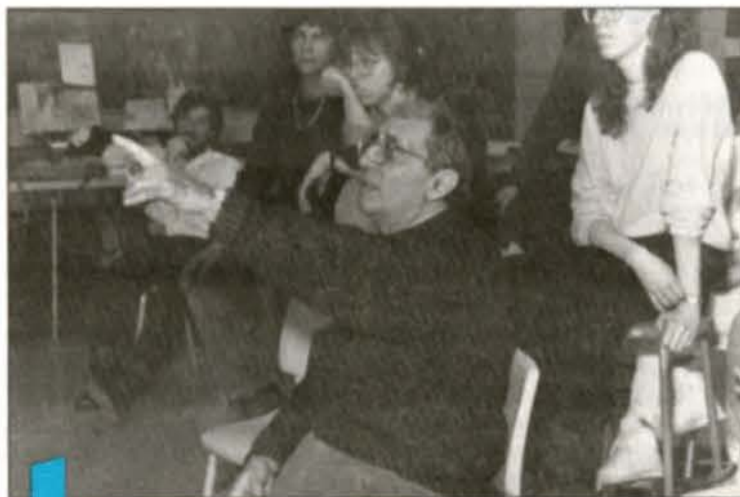
Extrait du vidéo Corps d'oeuvre , réalisé par Chantal du Pont.

À travers les discussions, le colloque laissera la place aux oeuvres elles-mêmes. Ainsi, à l'ouverture, le 15 mars à 17h30 et en présence du recteur Corbo, Chantal du Pont présentera la première de son vidéo Corps d'oeuvre , réalisé en collaboration