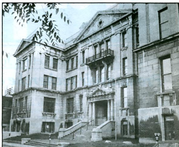
Le corps de bâtiment de l'ancienne École Polytechnique sera conservé.

Au cours des deux prochains mois, on procédera à l'engagement du directeur général du projet ainsi que des professionnels: architectes, ingénieurs en structures, mécanique et électricité. L'échéancier de quatre ans, déjà prévu, est maintenu, mais dû au retard apporté par le Conseil du Trésor dans l'octroi de la subvention (en octobre au lieu de mai), l'inauguration de la Phase II ira en 1990 au lieu de 1989. Autrement dit, il n'y a que les dates qui changent.